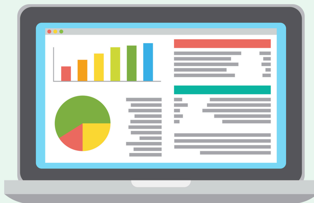
BÁO CÁO, THỐNG KÊ